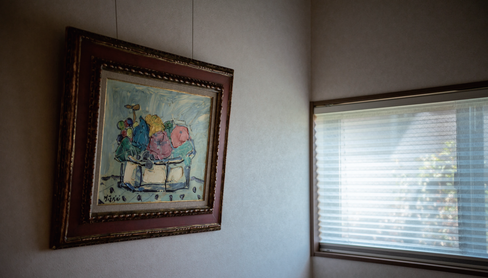
PAUL ALZPIRI (ポール・アイズピリ) 《静物》油彩 2004