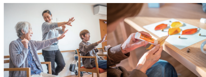
認知症対策の一環で体操は毎日行います それぞれが好きなことをして過ごします